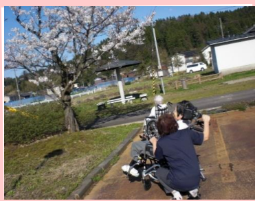
カメラが趣味のお客様が撮影してくださいました📷